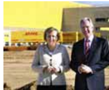
In Leipzig baut DHL einen der drei wichtigsten Knotenpunkte ihres Netzes (Bundeskanzlerin Dr. Angela Merkel und Dr. Klaus Zumwinkel).