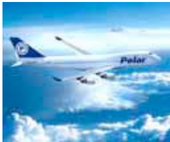
DHL gewinnt Polar Air Cargo als Partner und damit einen langfristigen Zugang zu den Routen zwischen Asien und den Vereinigten Staaten.