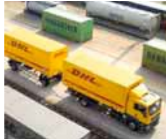
Der Konzern fasst sämtliche Speditionsgeschäfte in der Luft, auf See und in Europa auch über Land in der Logistiksparte zusammen.