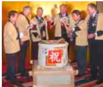
DHL Global Mail baut ihre Zusammenarbeit mit Yamato aus und ist der erste ausländische Anbieter auf dem japanischen Briefmarkt.